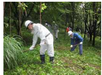
森林ボランティア体験