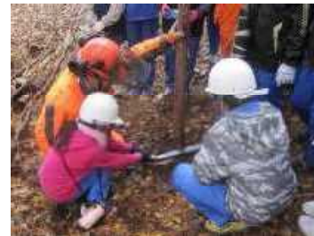
緑のインタープリター 活動状況