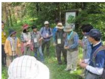
「緑のインタープリター」養成講座