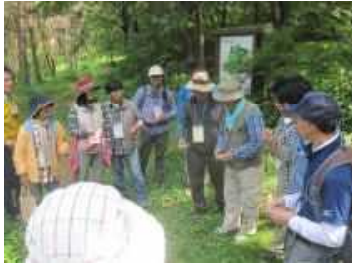
「緑のインタープリター」養成講座