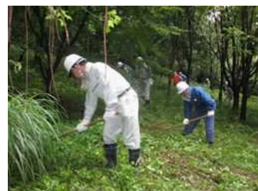
森林ボランティア体験