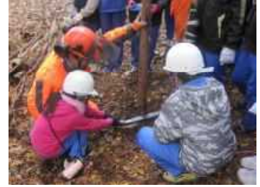
緑のインタープリター 活動状況