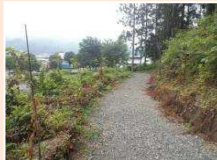
林道脇に植栽されたサクラ