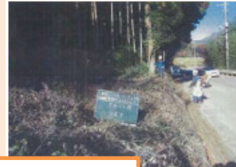
地域による取組状況