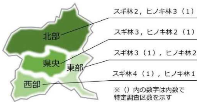
図一 地域ごとの調査地数