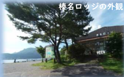
榛名ロッジの外観