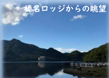
榛名ロッジからの眺望