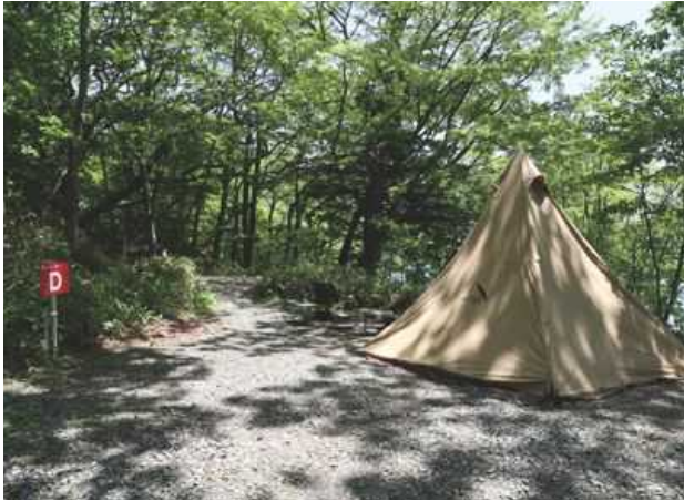
サイト D デュオ向けサイト / 約 50㎡