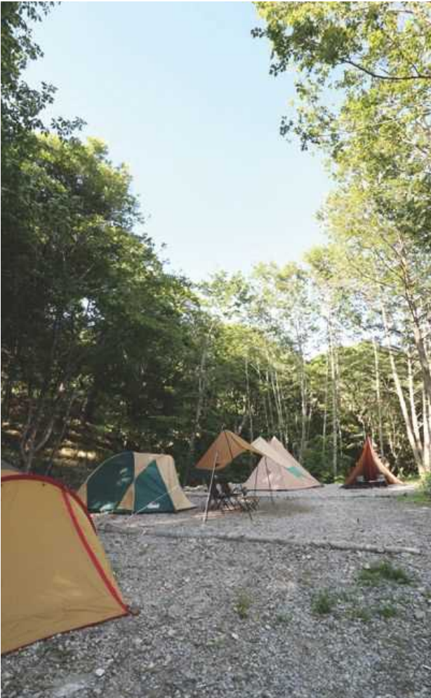
ファミリー向けキャンプサイト