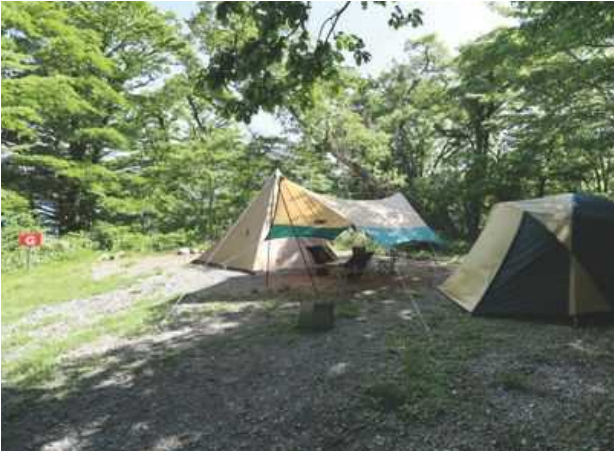
サイト G 2家族程度のグループ向けサイト／約 130㎡