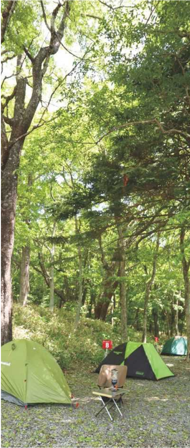
ソロ向けキャンプサイト