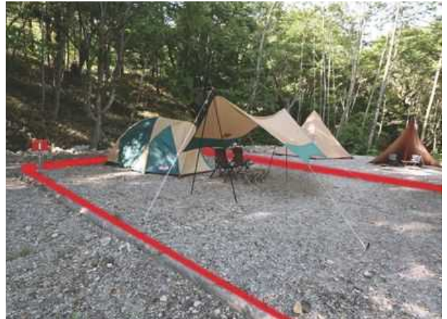
サイト I ファミリー向けサイト／約 80㎡