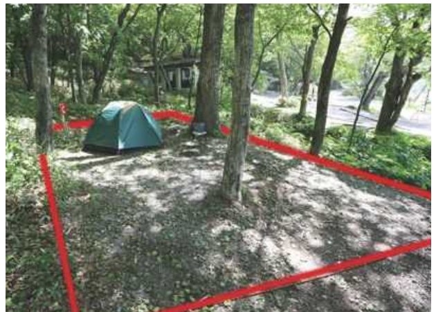
サイト C ソロ向けサイト / 約 30㎡ 区画境界線を赤く表示してあります。