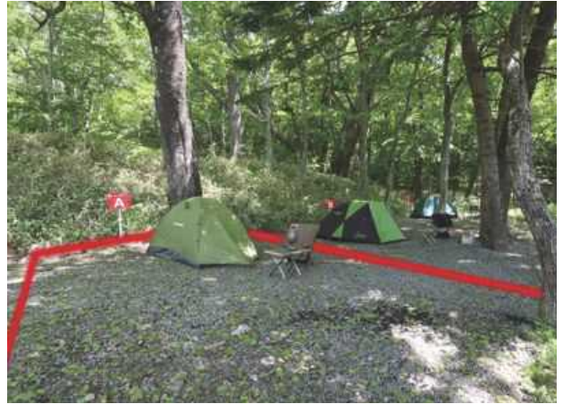
サイト A ソロ向けサイト / 約 30㎡ 区画境界線を赤く表示してあります。