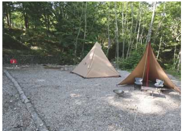
サイト J ファミリー向けサイト／約 90㎡