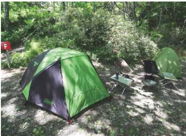
サイト F ソロ向けサイト / 約 25㎡ ソロテントなら 2 つ設営可