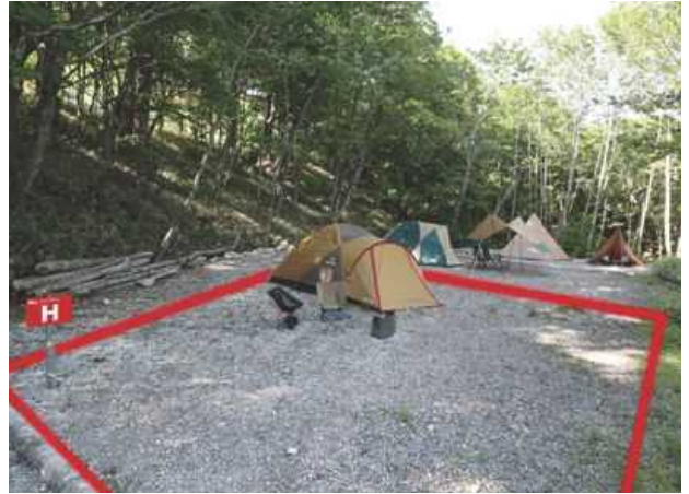
サイト H ファミリー向けサイト／約 100㎡ 区画境界線を赤く表示してあります。