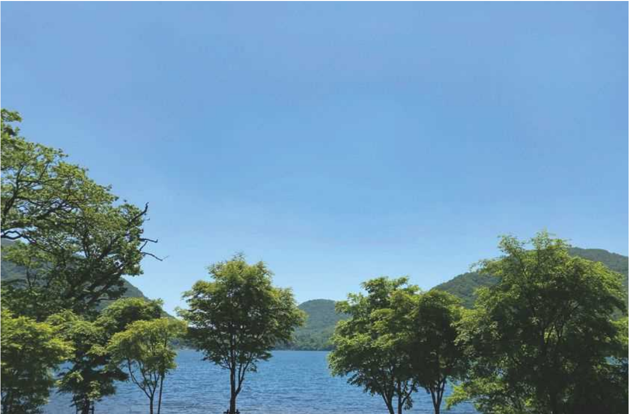
キャンプ場から臨む大沼