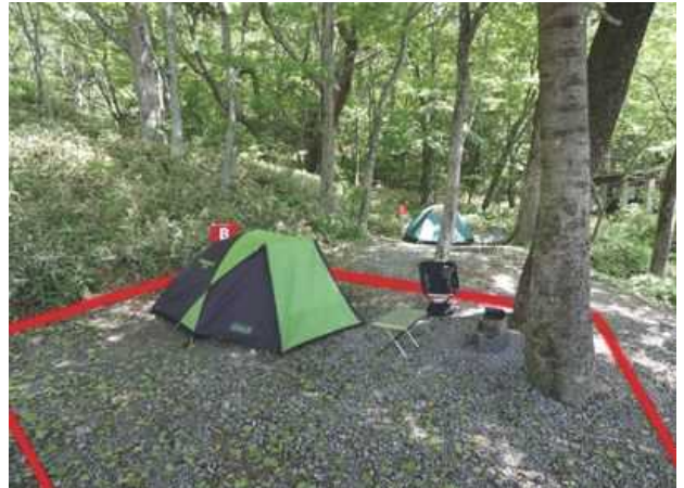
サイト B ソロ向けサイト / 約 40㎡ 区画境界線を赤く表示してあります。