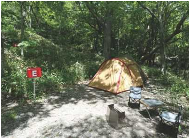
サイト E デュオ向けサイト / 約 45㎡