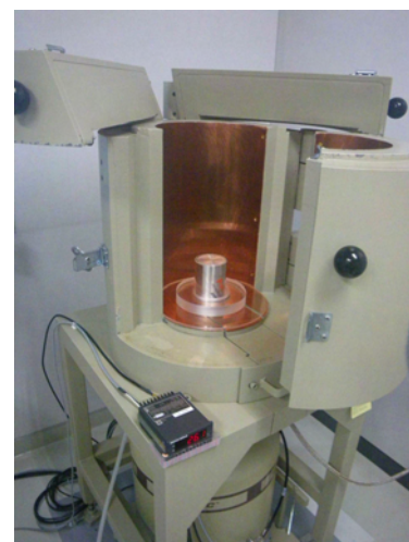
ゲルマニウム半導体検出器