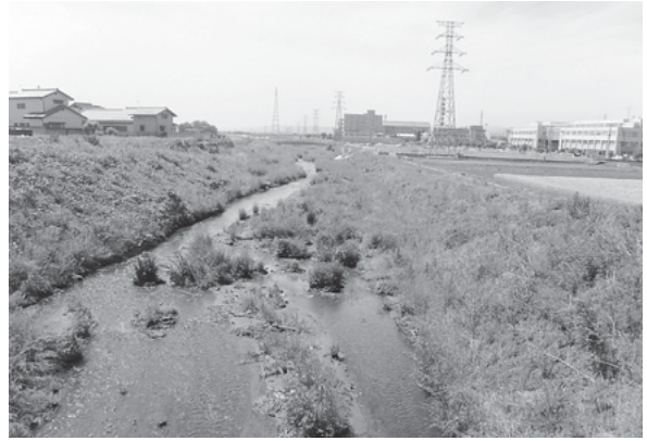
一級河川寺沢川 前橋市

ている自然の復元力を活用できるよう配慮し、約1.9kmの多自然川づくりを実施しました。