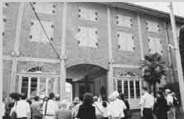
富岡製糸場 - 世界遺産登録に向けて

「富岡製糸場と絹産業遺産群」の世界遺産登録に向けて、先人の英知の結晶である文化財とともに、世界遺産にふさわしい環境や景観を未来へ引き継いで行きましょう。