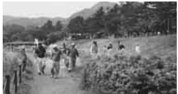
県クリーン重点地区清掃活動の様子

また、群馬県的生活環境を保全する条例で定める「環境美化の日（5月30日）」及び関東甲信越静環境美化推進連絡協議会が提唱する「一斉清掃日（5月29日）」にちなみ、みなかみ町水紀行館周辺を県クリーン重点地区に設定し、清掃活動を実施しました。