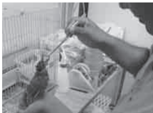
野鳥病院における傷病鳥の救護(林業試験場構内)