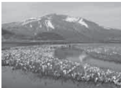
豊かな自然環境(尾瀬)

増えすぎた特定の野生鳥獣の食害等による農林水産業被害は依然として高水準にあるとともに、希少植物の食害など生物多様性の劣化が顕在化しています。これらの被害の軽減を図るため、「生息環境の整備」「防護」「捕獲」の対策を一体的に取り組みます。