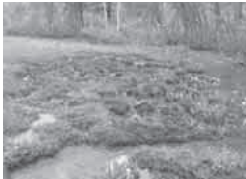
シカによる被害(湿原の踏み荒らしやミズバショウの食害)