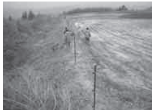
野生動物から農作物を守るために電気柵を設置