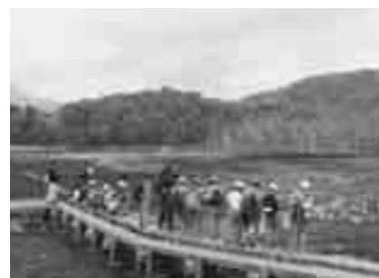
尾瀬学校の様子(尾瀬ヶ原)

群馬県では、ガイドを伴った少人数のグループにより、尾瀬の素晴らしい自然を体験するとともに、「自然保護の原点」といわれる尾瀬の自然を守る取組を学び、子どもたちの豊かな感性や自然保護への意識、さらには、ふるさとを愛する心を育むことを目的に、平成20年度から小中学校に対してバス代、ガイド代等の一部補助を行っています。