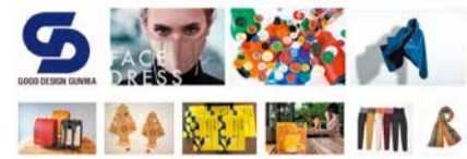
前回受賞商品(一部)