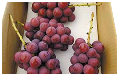
昨年度知事賞を受賞したナシ(上)とブドウ(下)