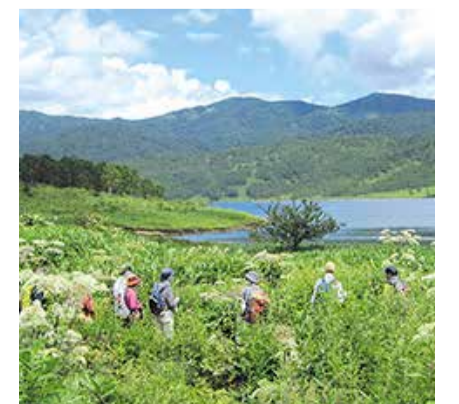
自然観察会の様子