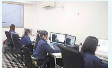
金型加工のデータを作成する様子

まずは、業務を誰でも同じ水準で行えるように熟練技術者の知識や経験をデータベース化しました。次に、業務の自動化と業務管理のデジタル化により、どの部品がどこにあり、どの工程まで進んでいるかといった情報を集約できるようにしました。このデータを納期情報と比較することで、進捗度や予定に対して遅れている原因が一目で分かるようになりました。