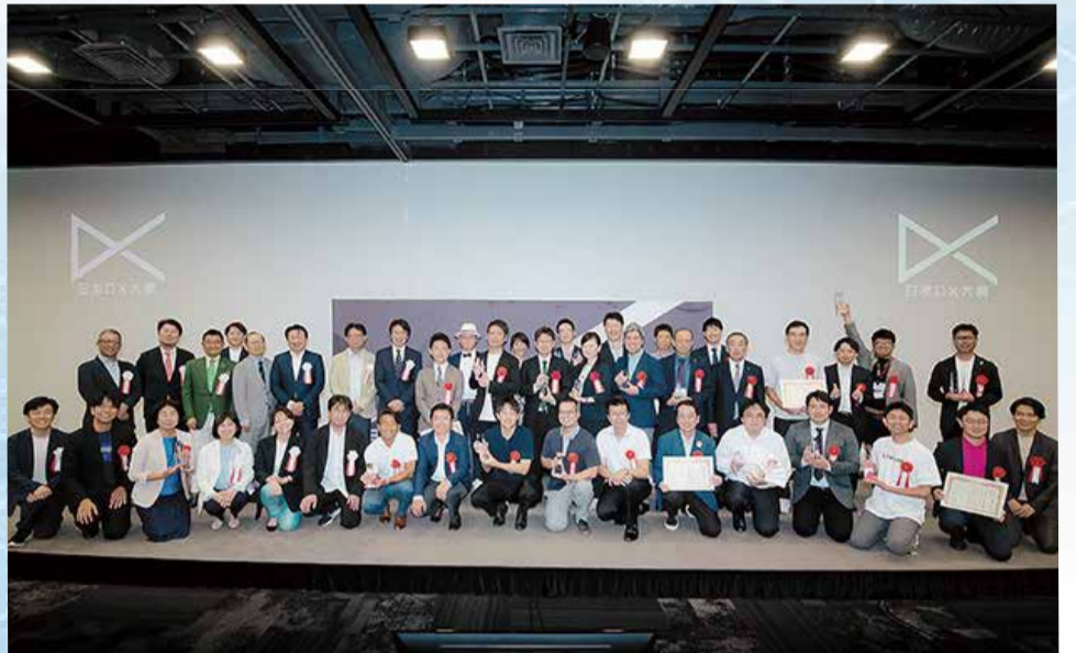
日本DX大賞2023 受賞者・審査員