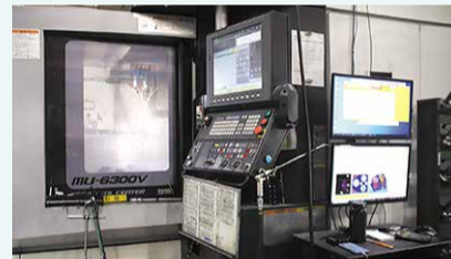
作成された加工データで金型を加工する機械

人為的ミス削減させ、生産性が1.5倍以上に上昇し、案件によっては納期が2分の1に短縮されました。面倒な作業が減り、時間や心の余裕が生まれた社員が、本業である金型加工技術の向上に一層力を入れてくれるようになりました。デジタル化により生産性が高まることで、社員の技術力もアップし、さらに生産性が上がるという好循環が生まれています。