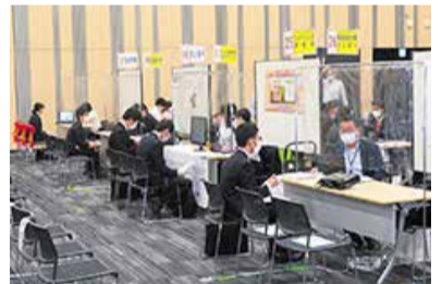
昨年度の説明会の様子