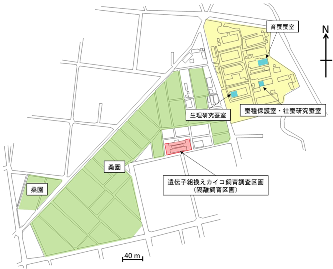
図3 群馬県蚕糸技術センター内配置図 赤く囲んだところが隔離飼育区画