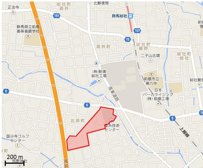
図2 蚕糸技術センター周辺の地形図 (Google マップより) 赤く囲んだところが蚕糸技術センターの敷地