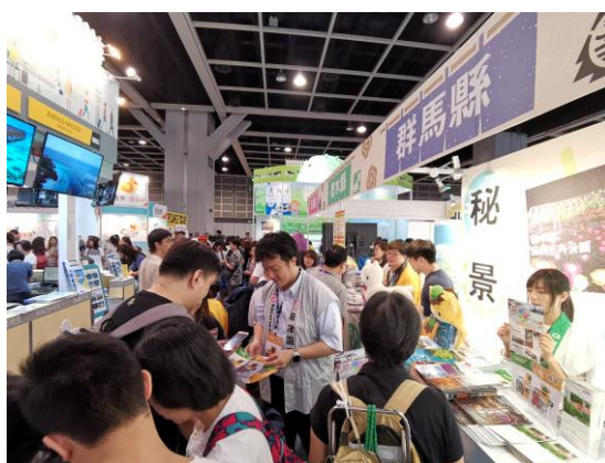
【香港国際旅行展示会（北関東共同出展）】