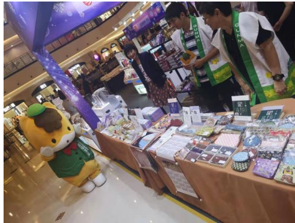
【伊勢丹ジャパンフェア】