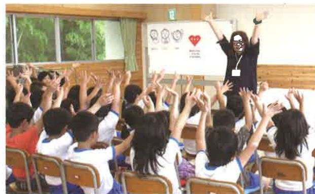
「あんしん」「じしん」「じゆう」を「けんり」と言葉で表現

この日は学習参観日でもあり、子どもたちの活動の様子を保護者が見守り、子どもと共に安全確保の方法について理解を深めました。