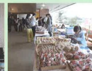
作品の展示・販売