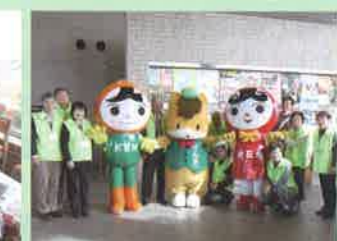
人権擁護委員さんが活躍