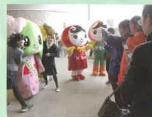
ゆるキャラと記念撮影

多くの方の参加で、楽しい人権啓発フェスティバルが開催されました。ミニ講演に合わせて、多文化共生推進士の活動を紹介するパネル展示も行われるなど、多彩なフェスティバルとなりました。