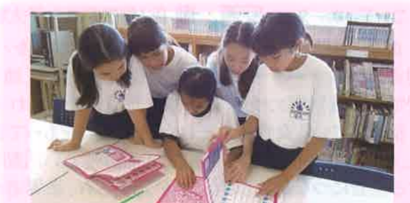
伊勢崎市立第四中学校での交流の様子

交流をととして、将来生活の拠点となる地域に自然に溶け込める下地をつくるとともに、視覚障害に対する理解を深め、よりよい人間関係を築く環境づくりにつながっています。今後もより充実しながら継続できるよう努力していきたくと考えます。