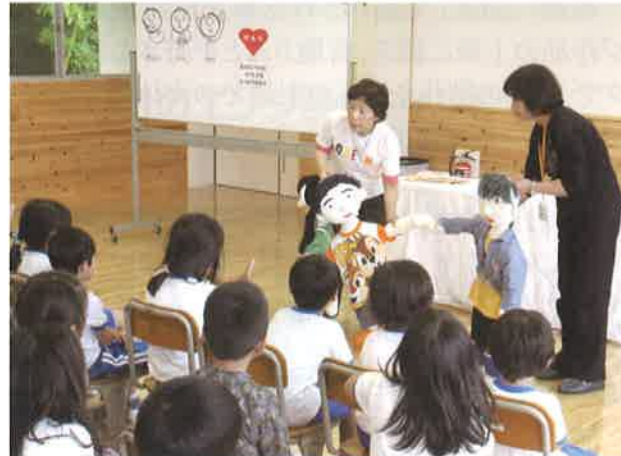
知らない人に捕まりそうになったらどう逃げたいか学習しました

犯罪者から自分の命を守る実践力を育てたい。そんな願いにこたえて、エンパワメントぐんまが小学校の児童を対象に防犯教室を実施しています。