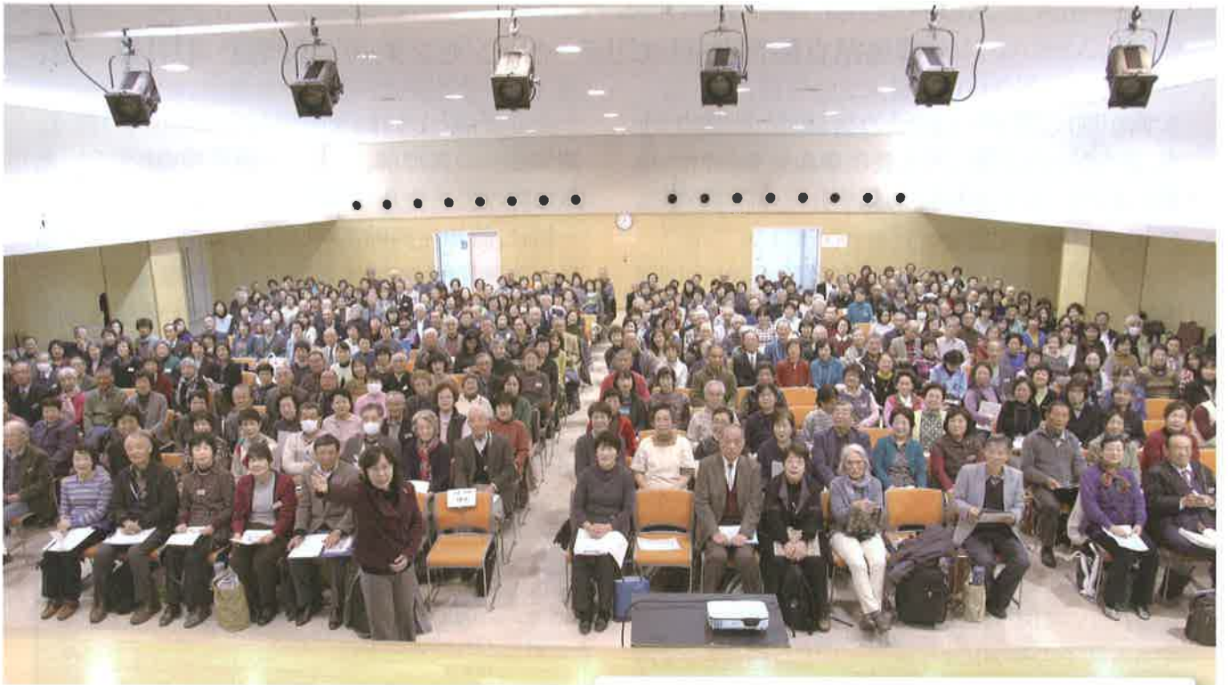
みんなで楽しく学んでいます！ 前橋市中央公民館「明寿大学」