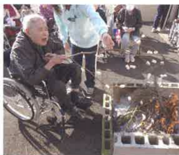
新年恒例のどんと焼きで繻玉を焼くご利用者

当園も他の施設同様、ご利用者にとって家庭・地域社会の延長である生活の場として、安心・快適で潤いのある生活を送っていただけますよう、毎月の誕生会をはじめ花見等四季折々の行事はもとより、お酒も提供する納涼祭、忘年会、新年会等も開催し、明るく元気に家庭的な雰囲気の中で毎日生活をしていただいています。