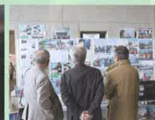
人権啓発展示コーナー