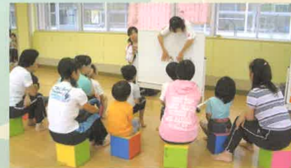
県内の特別支援学校における 幼児を対象とした教室

談員を配置して小中学校等からの要請に応じて支援を行っています。また、各特別支援学校も同様に小中学校等への支援を行うとともに、保護者からの相談や子どもたちへの支援のための相談会などを行っています(写真参照)。また、県総合教育センターの「子ども教育支援センター」では発達や障害そして教育に係わる相談を総合的に受け付けています。