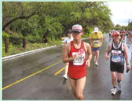
ホノルルマラソンでの一コマ

本校は、知的障害教育を行う学校です。現在小学部17名、中学部19名、高等部16名、合計52名の子どもが在籍し、教職員は、35名です。昭和54年に養護学校として開校し、平成19年に学校教育法の改正を受けて特別支援学校と校名を改めました。開校以来「子どもがい