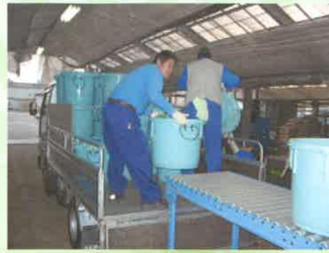
生ゴミ回収業者がトントラック2台で小・中・幼・養護学校を回り、生ゴミを処理場に届けます。

悪口は絶対言わない。挨拶はきちんとする。外回りのトラックが帰れば、自分の仕事を止めて荷おろしを手伝う。教えなかった接待。遠くで見えたら、肥料3袋900円い