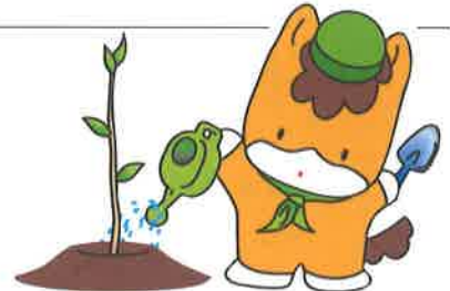
ぐんまのマスコット「ぐんまちゃん」