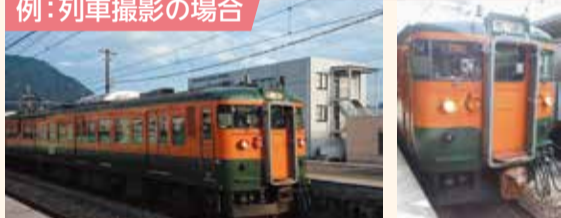
列車を撮影する場合、横で撮影すれば、列車の動きを伝えやすくなります。被写体によって、縦と横を使い分けてみてください