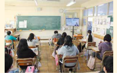
オンライン形式で実施された学習会の様子

土砂災害の映像を見て、本当に危険なものだと分かったので、大雨が降った時には外にはきょくりょく出ないようになり、危険な場所からはなれたりして自分の身を守りたいです(6年生)