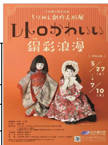
企画展ポスター表紙