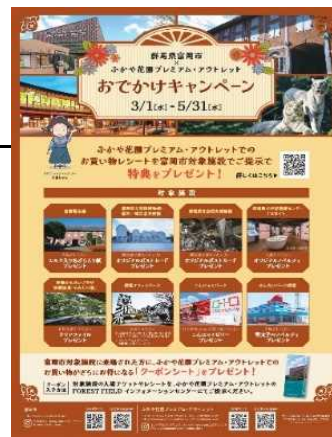
キャンペーンチラシ