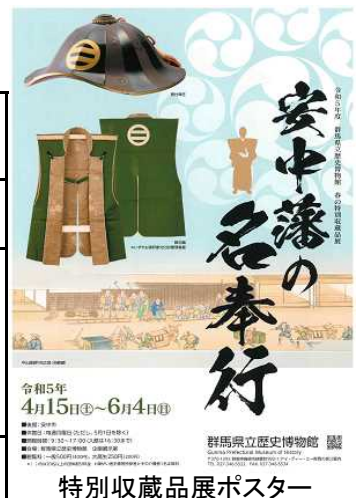
特別収蔵品展ポスター