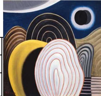
鶴岡政男《静かなる夜(山と月と湖)》1955年 当館蔵

最新の情報は当館ホームページでご確認ください。 【美術館HP】 https://www.gmat.pref.gunma.jp/