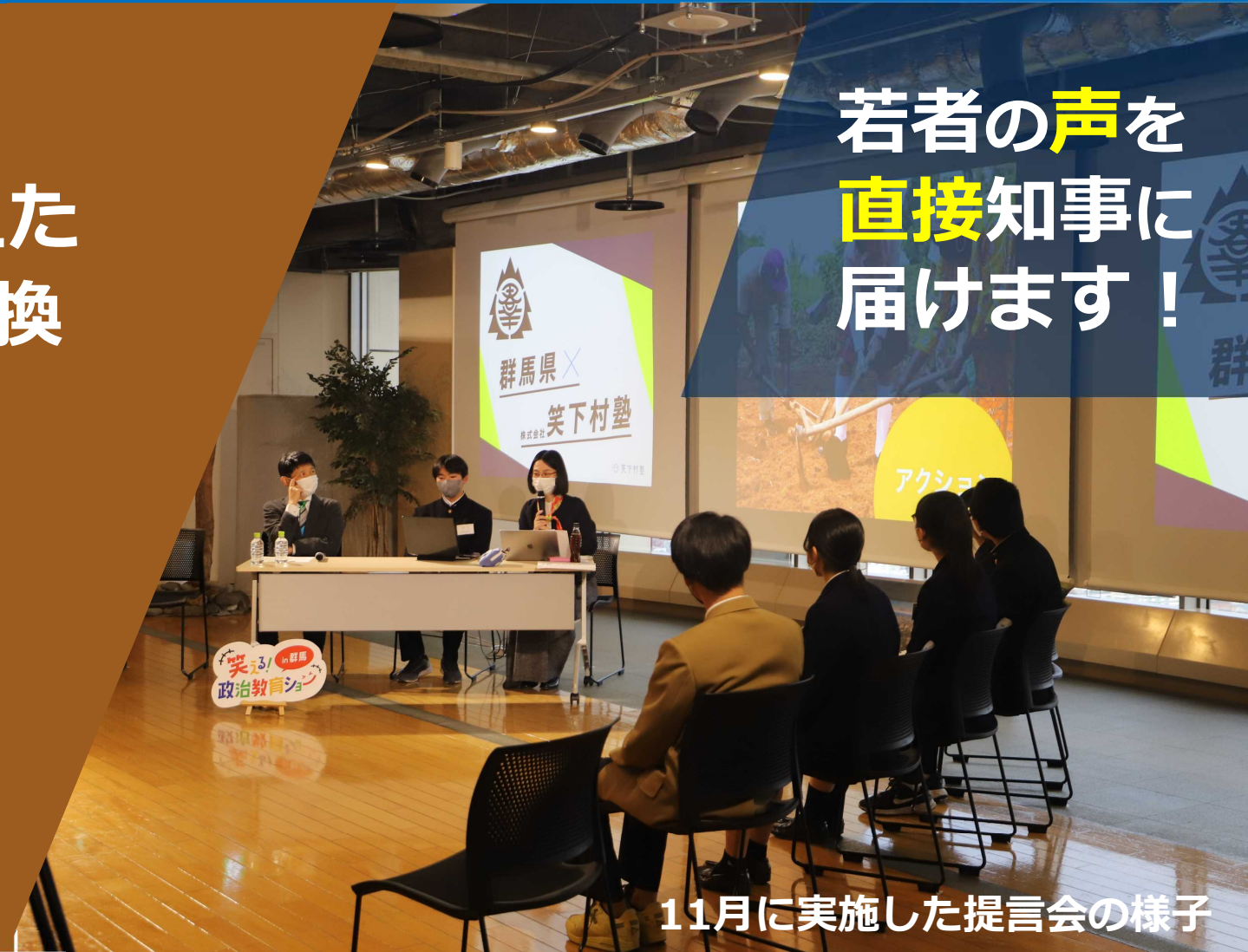
11月に実施した提言会の様子