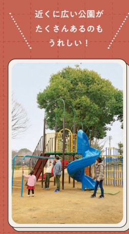
近くに広い公園がたくさんあるのもうれしい!