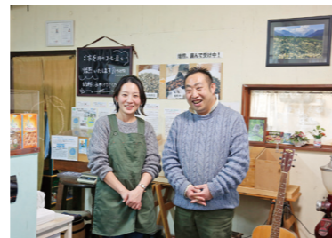
「ここを選んでよかった」と笑顔で話してくれたご夫婦。