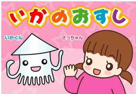
(協力:kirakira イラスト: 山口美那枝)

県や県警察では、防犯に役立つ動画を作成して県公式YouTubeチャンネル「tsulunos」で公開しています。ぜひご覧ください。