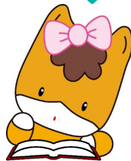
群馬県のマスコット「ぐんまちゃん」