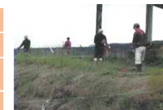
4 大笹地域の農地維持【嬭恋村】