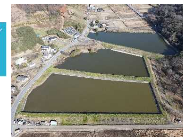
3 西長岡ため沼 【地震対策詳細設計】