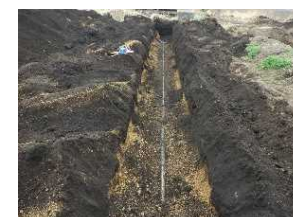
5 北ろく赤谷地区【石綿セメント管撤去工事】