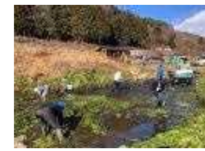
4 富士山地区【わさび田整備】