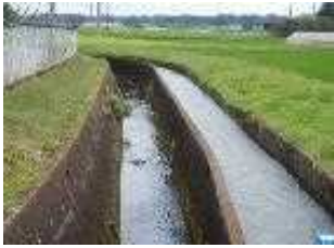
2 神流川用水地区【施設状況】