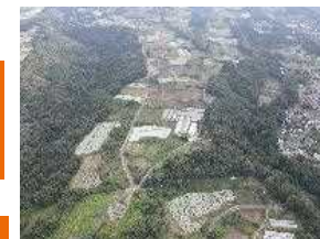
1 笠張地区【未整備状況】