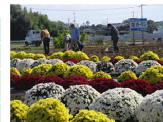
4 景観形成活動【前橋市】