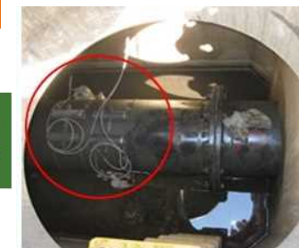
2 利根加用水2期地区 【工事着手前】