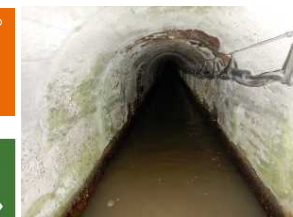
2 追貝平1期地区【事業着手前】