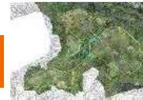
1 牛の平地区【工事計画】