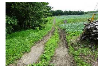
1 仙之入地区【工事着手前】