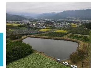
3 藤塚地区【調査実施前】