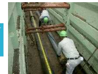
3 榛名東部地区【管路工事状況】