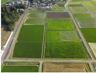
1 牛田川除地区【営農状況】