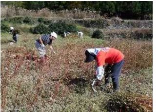
4 那須地区棚畑・景観保全推進協議会の蕎麦栽培の普及活動【甘楽町】