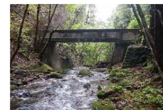
2 美野原3期地区【工事着手前】