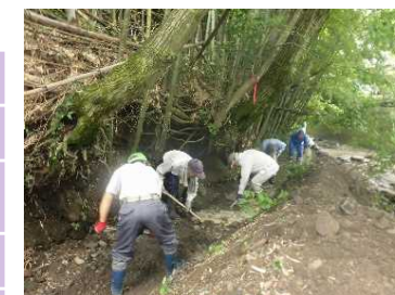
4 桐生市童沢地区 【水路の堀さらい】