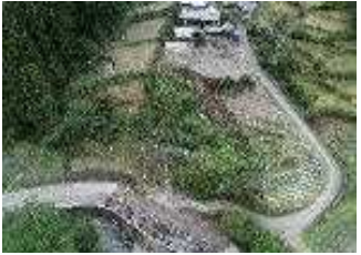
3 河振地区【地すべり対策】