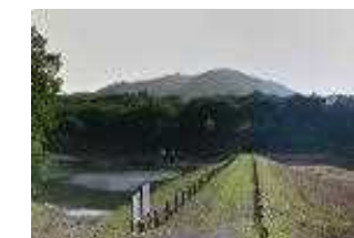
3 梅沢貯水池【劣化状況評価調査・ハザードマップ作成】