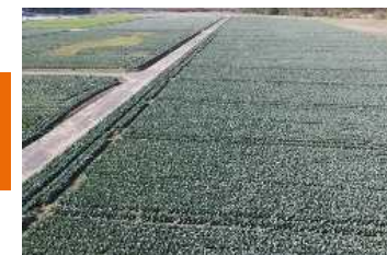
1 下江黒地区 【整備後の営農状況】