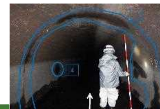
2 坂東大堰2期地区【暗渠内劣化状況】