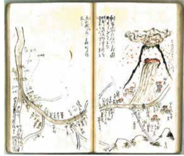
「天明癸卯帖 二」(松井家旧蔵文書)