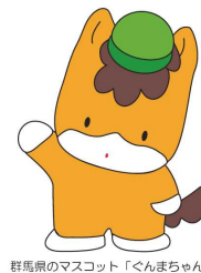
群馬県のマスコット「ぐんまちゃん」