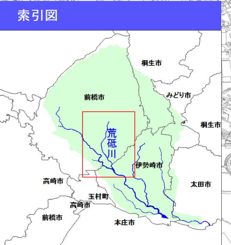
利根川水系荒砥川洪水浸水想定区域図(計画規模)