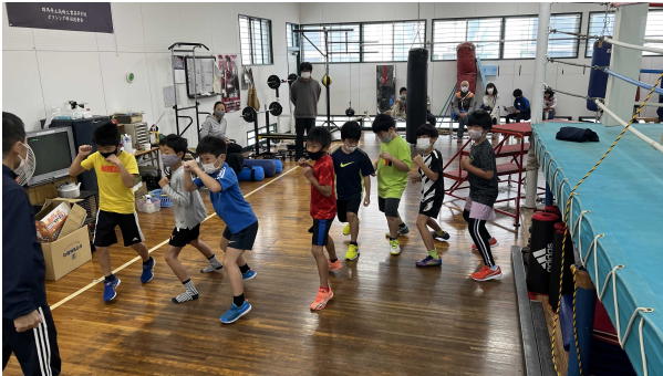
基本ポーズ(フットワーク)の練習