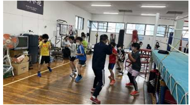
基本ポーズ(フットワーク)の練習