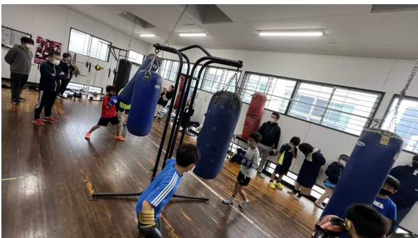
サンドバッグ打ち