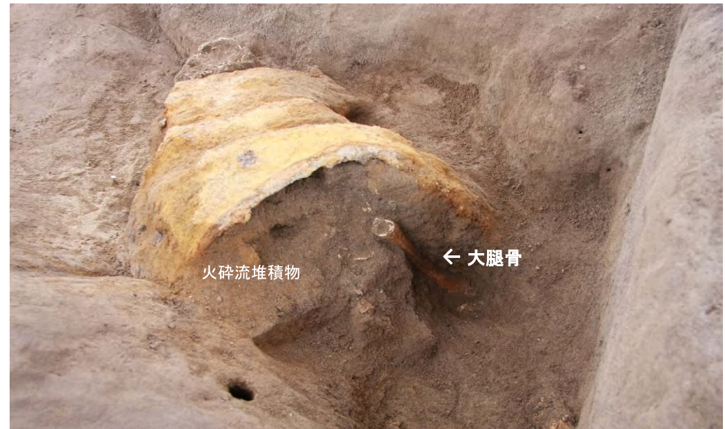
4. 甲の下位から出土した大腿骨(北方より)