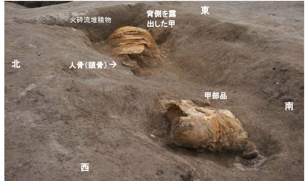
2. 同左部分拡大(西方より)