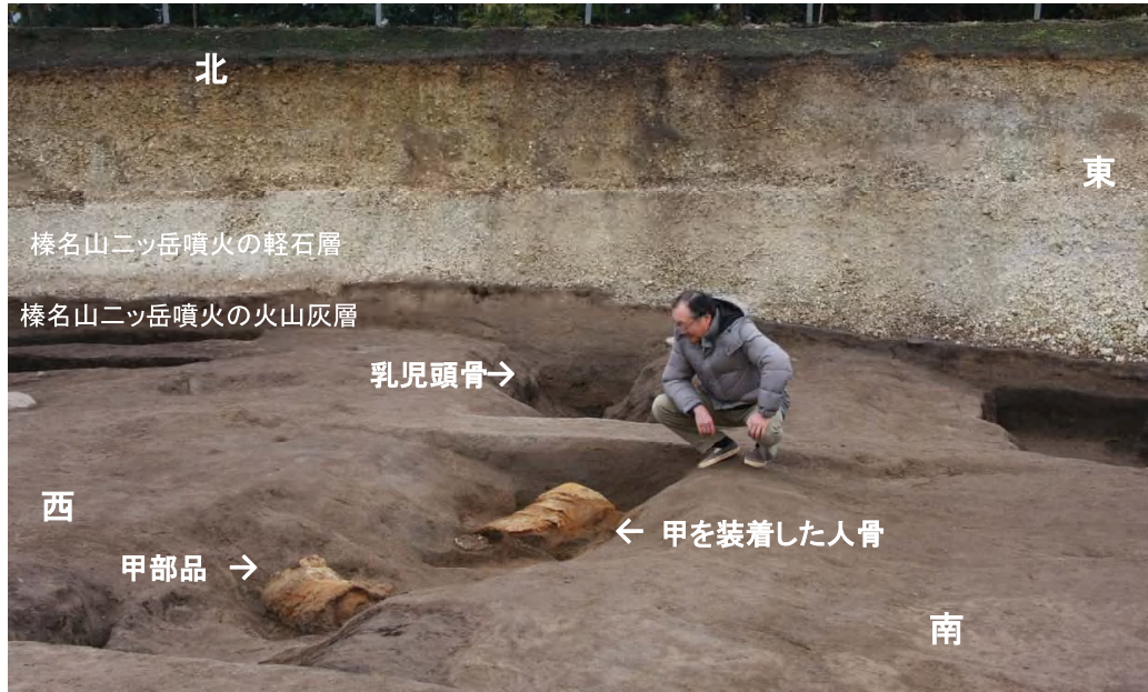
1. 溝状遺構内の甲と人骨の出土状況(西方より)