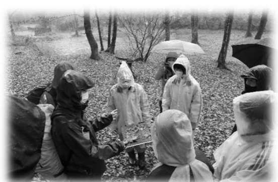
中高環境講座（1年生）