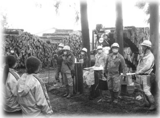
森林組合間伐現場の見学