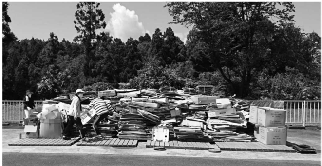
↑回収できた廃品物

夏季休業中に実施している廃品回収。今年度からは「生徒会活動の資金を自分たちの手で」という目的で、生徒会との共催とし、P T Aと生徒が協働して取り組んでいる。