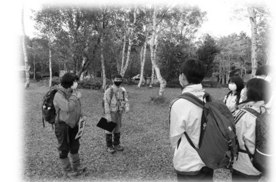
中高自然観察会（2年生）