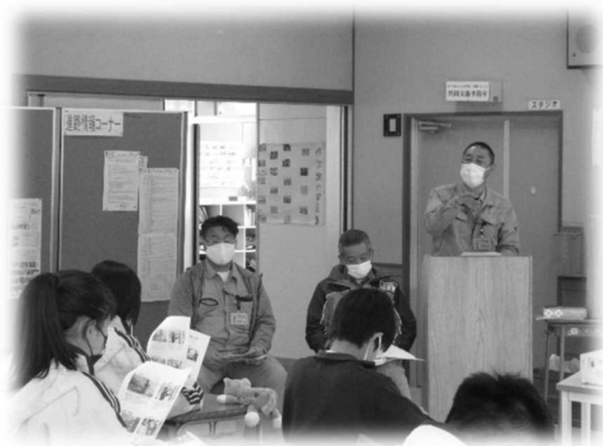
森林組合職員による講話