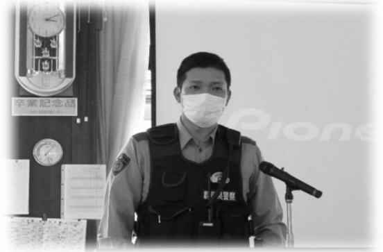
追貝駐在所長によるSNS講演会