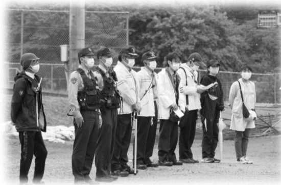
マラソン大会の走路観察