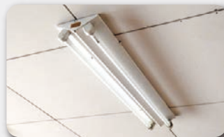
業務用・施設用蛍光灯の安定器