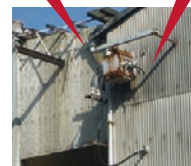
高圧コンデンサー