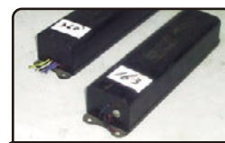
業務用・施設用蛍光灯の安定器