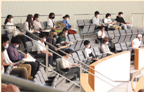
議場内で一般質問のやりとりを傍聴