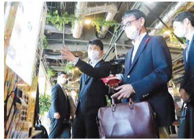
NETSUGENを視察する山本一太知事(左)と河野デジタル大臣

県では、デジタル活用に取り組む自治体の先進事例や、マイナンバーカードの利便性をより多くの県民の皆さんに知っていただき、デジタル化の推進とともに、その基盤となるマイナンバーカードの普及率向上に努めていきたいと考えています。