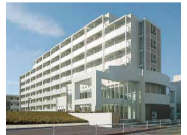
交通の便が良い立地の上毛学舎