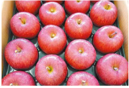
2年の上位入賞品「ふじ」

商品完売まで ・出品物の展示…正午から3時まで ・出品物の販売…3時から展示品完売まで ※午前11時から整理券を配布 ¥ 無料 ☎ 県庁蚕糸園芸課(☎027-226-3136)