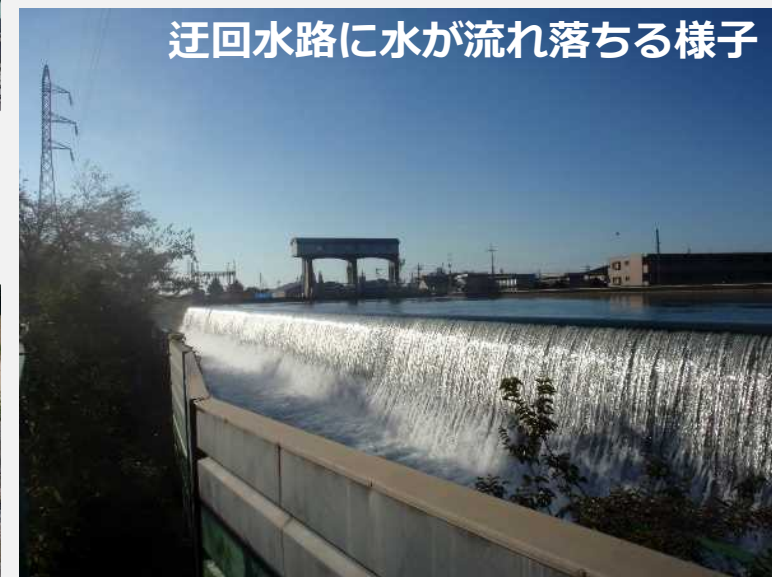
迂回水路に水が流れ落ちる様子