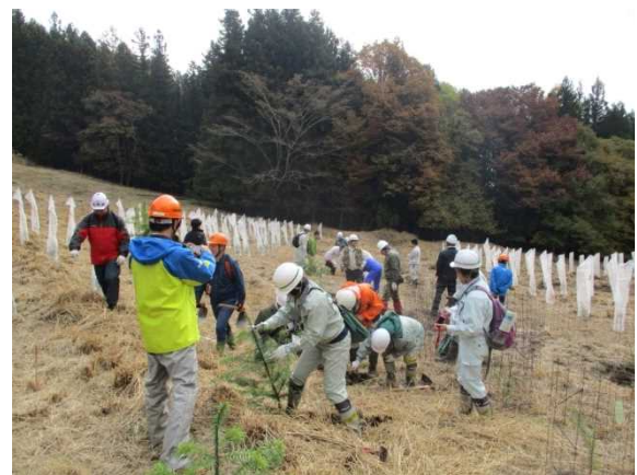
図-4 コウヨウザンの植栽体験