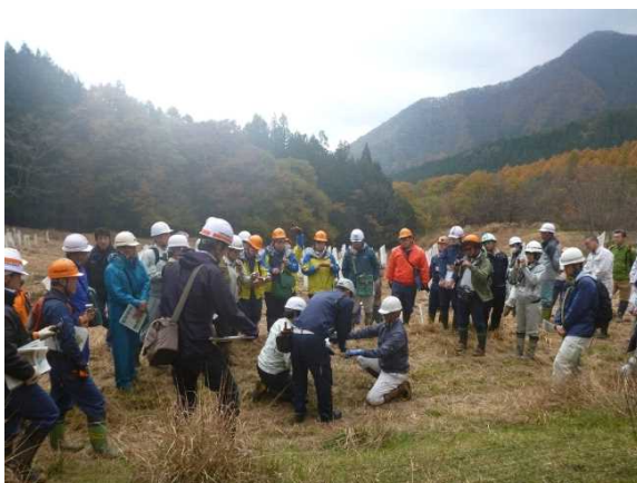
図-3 単木柵の設置体験

利根沼田森林管理署主催の元、植栽後の2019年11月11日に、県内の林業関係者を対象に現地検討会を開催した。検討会では、コウヨウザンの説明や試験地の概要、林業試験場考案した単木柵の設置体験およびさし木増殖により育苗したコウヨウザンの植栽体験を行い、普及啓発を行った(図-3、4)。