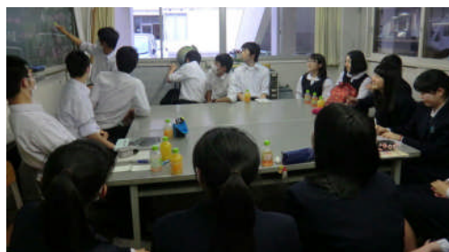
すでに両校の生徒会を中心に交流が始まっています。

※「人品雅致」とは、「人柄に優れ、品位があり優雅なさま」のことで、知徳体の調和を目指す教育目標です。