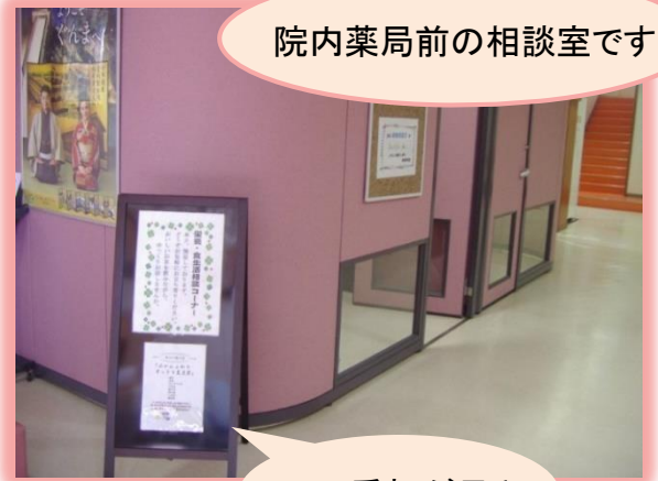
院内薬局前の相談室です