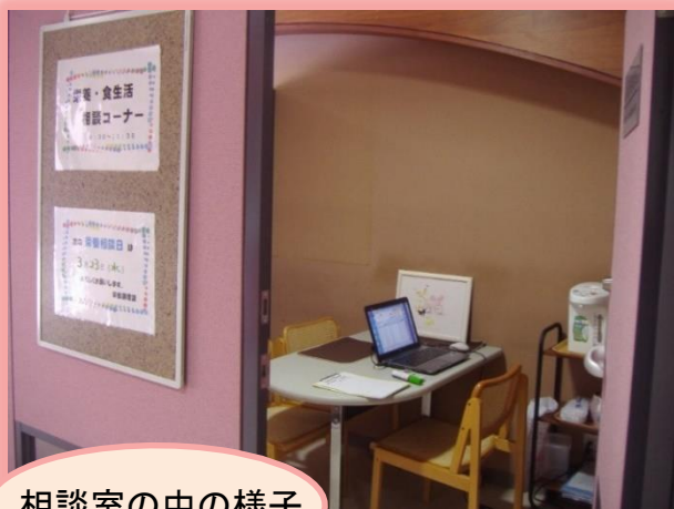
相談室の中の様子

「日替わり漢方茶」のお持てなしもございますので、 おいしいお茶を飲みながら、ゆったりと相談されてはいかがでしょうか。