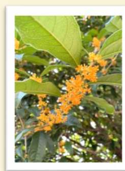
良い香りのキンモクセイ