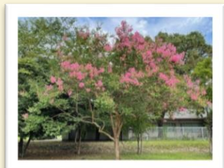
夏の終わりのサルスベリ

当院の庭は地域の方にも開放しております。 遊歩道やグラウンドなど、ぜひご利用ください。