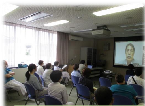
当院の職員にもLive配信