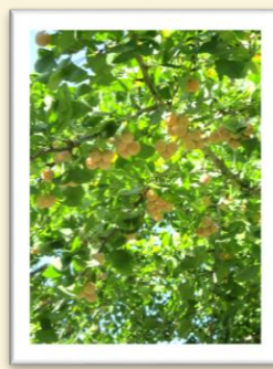
たわわに実るギンナン