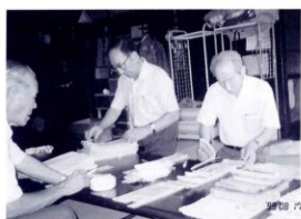
古文書調査の様子