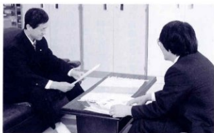
県民の生活に根ざした展示を見ていただきたい