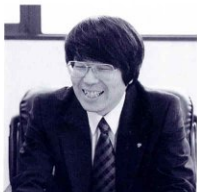
文書館の感想は？ (秋池新館長)