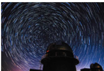
2019写真展作品 「巡るカシオペア座、北斗七星とドーム」

美しい天体の姿に引き込まれること、壮大で神秘的な世界に圧倒されること間違いなしです！