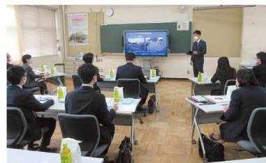
学校からの説明を受ける

動画配信サービスやWEB会議システムを活用した学校行事(運動会、社会科見学、授業参観など)の実施について説明後、授業を視察しました。