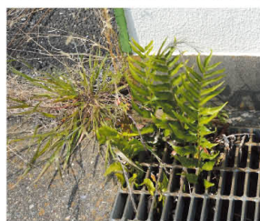
オニヤブソテツ (群馬県立自然史博物館)