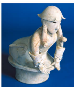
塚廻り4号墳/跪坐の男子 (国重要文化財)

1450年以上も昔に、この地に生きた人々によって創作された「すばらしき群馬のはにわ」の躍動感をぜひともご堪能ください。