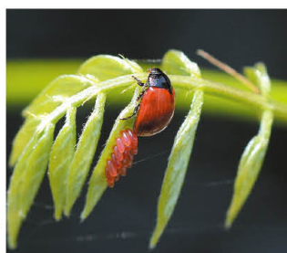
昨年度のベストショット部門最優秀賞 「ルビーの子供もルビー」 水上 貴夫

さまざまな作品から、昆虫の特徴や子どもならではのユニークな視点を知ることができ、また、普段見ることのできない珍しい昆虫の写真を鑑賞することもできます。