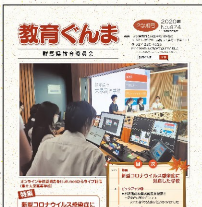
冊子の教育ぐんま

今後はLINEと群馬県教育委員会のホームページで、県の教育関連情報を発信します。