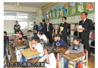
4年生の英語の授業

英語の授業を中心に視察しました。歌や会話を取り入れた授業に、委員から「楽しく英語を学ぶ様子が印象的だった」と意見がありました。