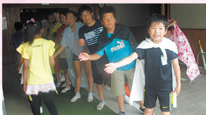
あいさつ運動の様子