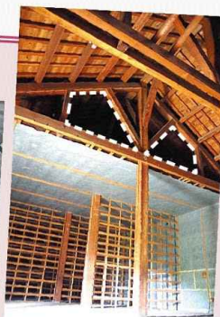
西置繭所のトラス