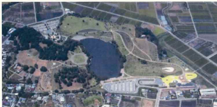
画像3 五料沼と大室古墳群➡