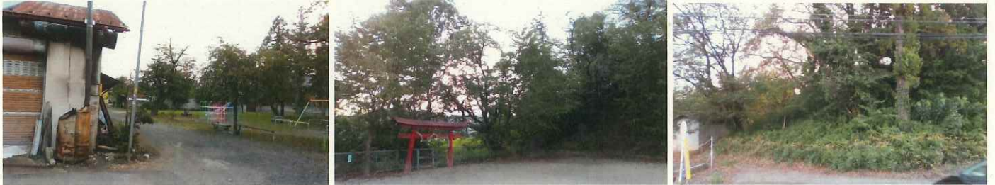
(鳥崇神社 鳥崇神社古墳)