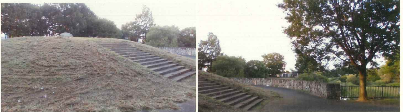
(オクマン山古墳)