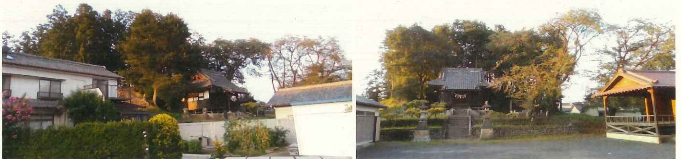
(菅原神社 亀山古墳)

このように今現存する古墳は神社や公園などの公共施設が併設してあることが多い。逆に言えば神社が祀られてたから、今もなお人々のそばで大切にされているのかもしれない。