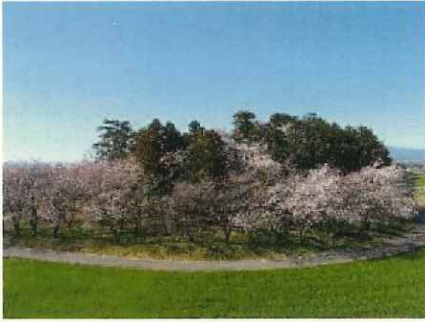
←画像5 桜が綺麗な、お富士山古墳