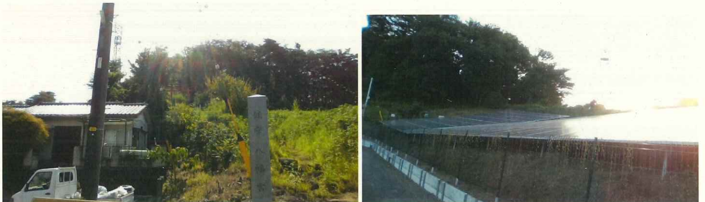
(八幡山古墳 大島八幡神社)