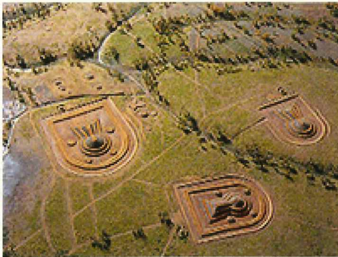
画像1 上空からの古墳群と公園➡