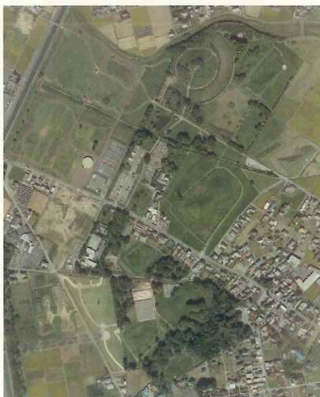
↑ 埼玉古墳群・さきたま古墳公園

別名男体山古墳ともいわれ、東日本では最大、全国では30位以内の規模を誇る前方後円墳です。北東には、天神山古墳と関連があると思われる陪塚（天神山古墳A陪塚）があります。江戸時代には、棺に使われていた長持形石棺（ながもちがたせっかん）が発見されています。埴輪の特徴等から5世紀頃作られたもので、畿内大和政権と強いつながりを持っていた毛野（けぬ）の国の大首長が埋葬されていると言われています。