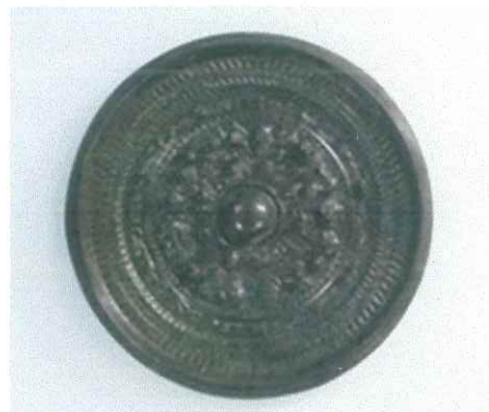
⑩天王日月獣文帯四神四獣鏡 前橋市 前橋天神山古墳