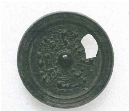
⑦正始元年陳是作同向式神獣鏡 高崎市 蟹沢古墳