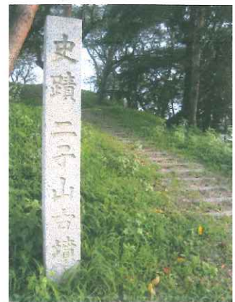
↑ 総社二子山古墳 6世紀後半の大型前方後円墳

つまり、現在の古墳時代史が究明され、私達が古墳や副葬品に関する知識を得ることが出来るのは、宮内庁による精密な陵墓をはじめとした古墳の調査のおかげなのである。