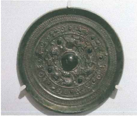
①画像文帯龍虎鏡 富岡市 北山茶白山古墳