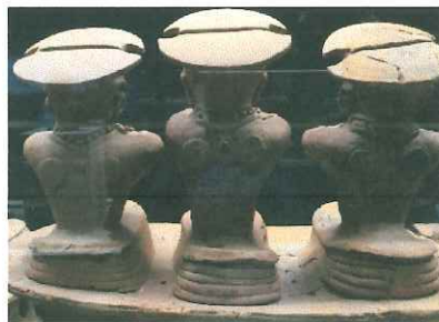
↑三人童女の背面 丸いものが鏡 ↑正面から 双方とも群馬県立歴史博物館にて撮影

・高崎市綿貫観音山古墳出土の「 三人童女 」は、3人それぞれ背中に2枚ずつ鏡をつけている。