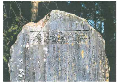
↑北山茶白山古墳の石碑

しかし、近隣には弥生時代の大きな集落遺跡「中高瀬観音山遺跡」があることから、力のある豪族が葬られたと推測できる。