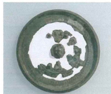
⑧獣文帯三神三獣鏡 高崎市 蟹沢古墳