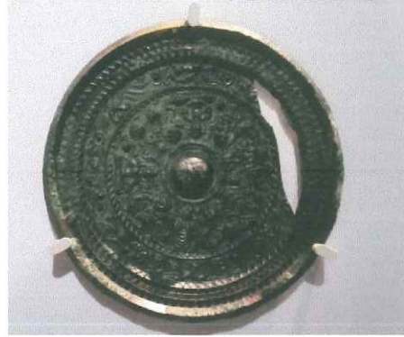
⑫獣文帯四神四獣鏡 板倉町 赤城塚古墳