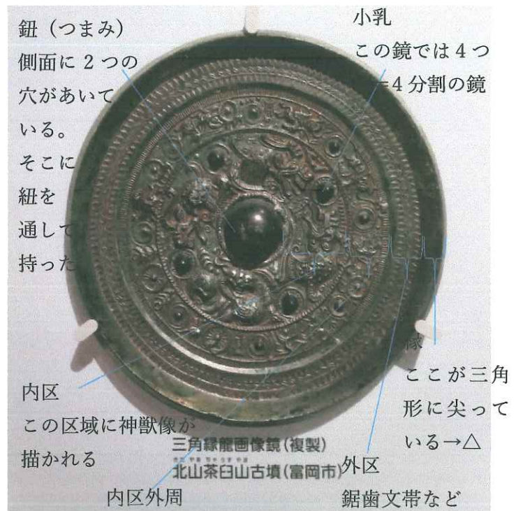
↑三角縁神獣鏡の部位の名称