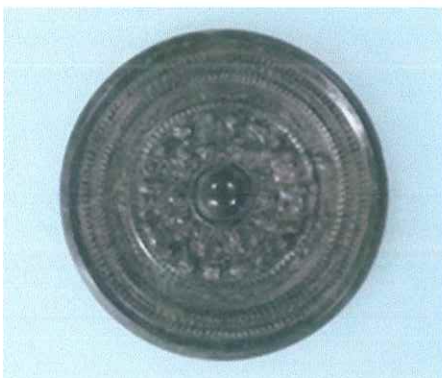
⑨天王・日月獣文帯五神四獣鏡 前橋市 前橋天神山古墳