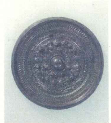
↑三角縁四神四獣鏡

このように博物館が大好きな私であるが、今回の講演会を見つけた際に「宮内庁」に疑問を持った。なぜ宮内庁と古墳が結びつくのだろう。博物館とは違ったロマンを感じ、新たな知識を得たい！と思い、拝聴しようと思った。